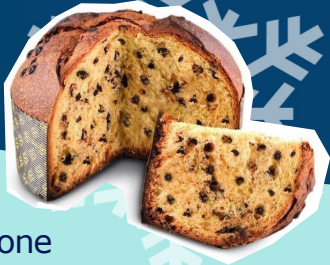
Panettone al cioccolato fondente 900 g € 14,00