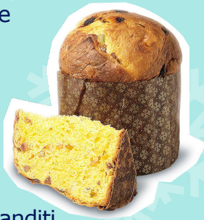
Panettone all'uvetta e canditi 900 g € 13,00