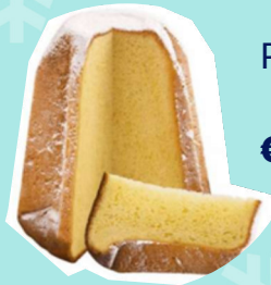
Pandoro 750 g € 14,00