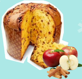
Panettone mela e cannella 750 g € 14,00